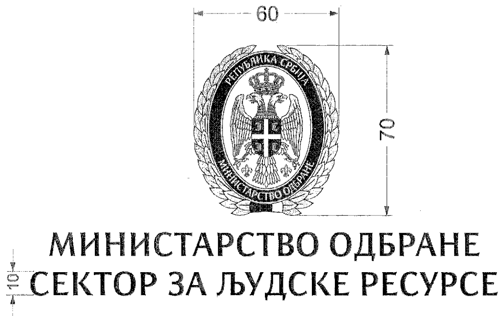
Слика 1. Идејно решење и димензије знака (димензије на слици изражене су у cm)

Знак Министарства одбране и натпис организационе целине (у даљем тексту: знак) представља хералдичку композицију чију основу чини бели овални штит са хромираним (боја сребра) лоровим венцем, који је у доњем делу обавијен траком у бојама заставе Републике Србије.