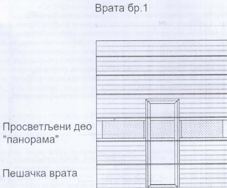
Слика број 1

Начелни изглед приказан је на слици број 1.