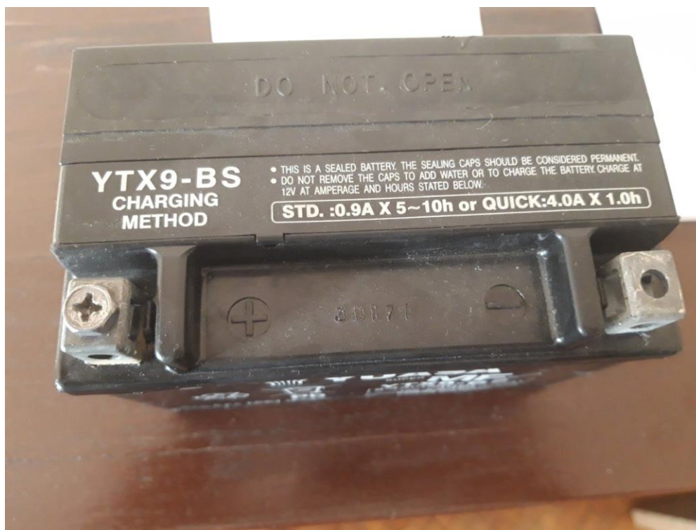
Слика број 4: Пример акумулатора 12V 8,4Ah