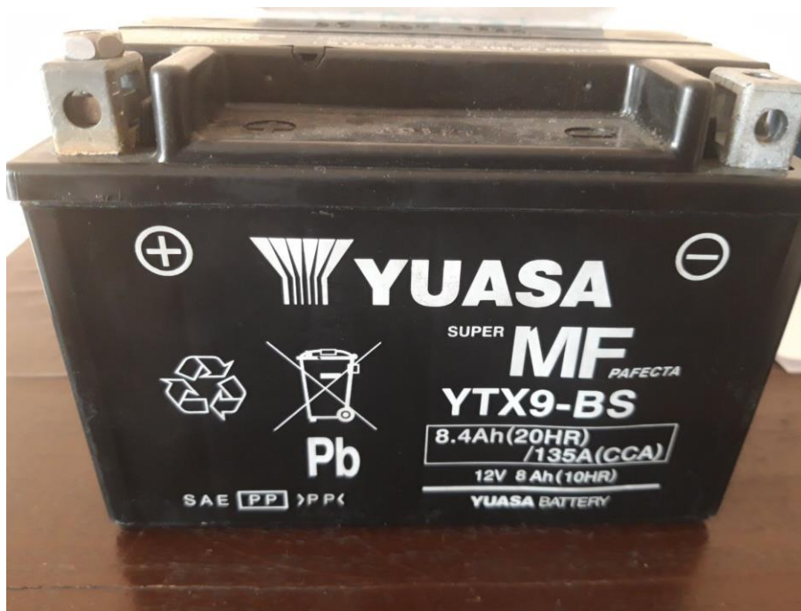
Слика број 3: Пример акумулатора 12V 8,4Ah