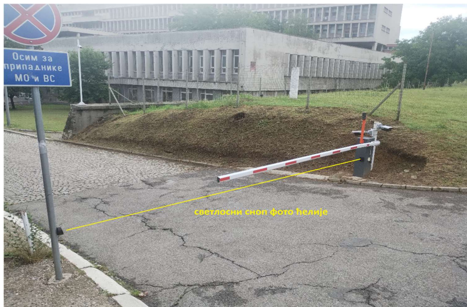
Слика 2. Предметна паркинг рампа (НАПОМЕНА: летва је више пута хаварисана па је скраћивана; потребне димензије су приказане на слици 3.)