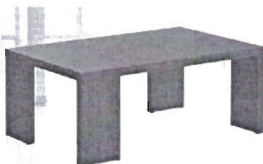
слика: приближан изглед