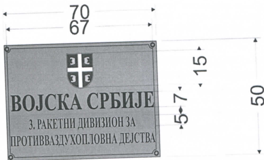
Слика 3: Димензије табле 1

Димензије табле на улазу у војни објекат приказан је на слици 2.