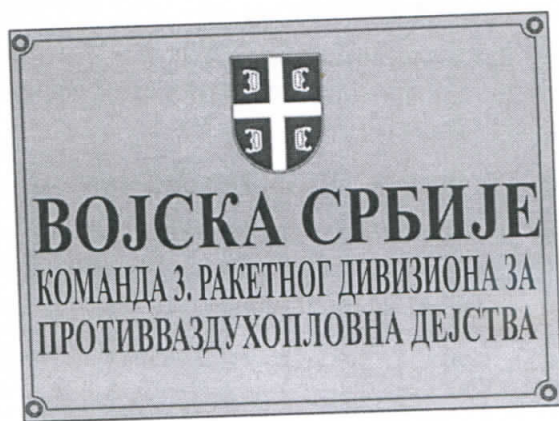
Слика 2: Изглед табле 2

Димензије табле на улазу у војни објекат приказан је на слици 2.