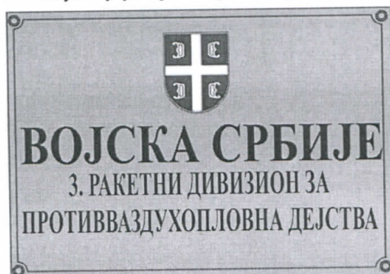
Слика 1: Изглед табле 1

Изглед табле на улазу у војни објекат приказан је на слици 1 и 2.