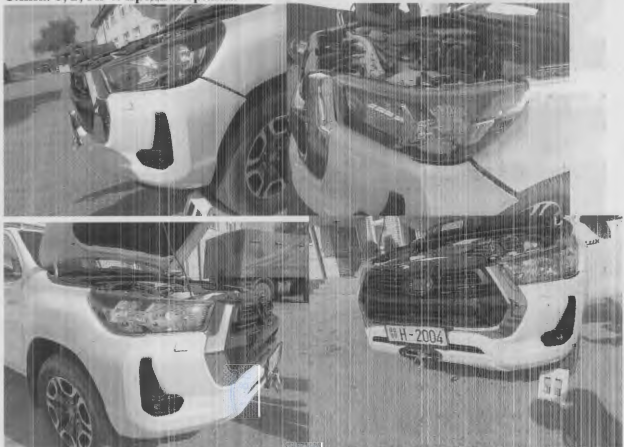
Слика 1, 2, 3и 4: предњи браник