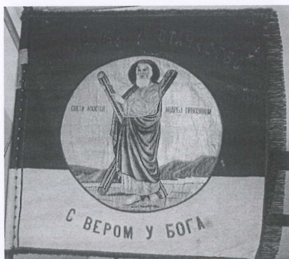
Slika 1: Аверс пуковске заставе

Отпорност на цепање у правцу: основе минимално 5 daN, потке минимално 4 daN, према SNO 8183/91.