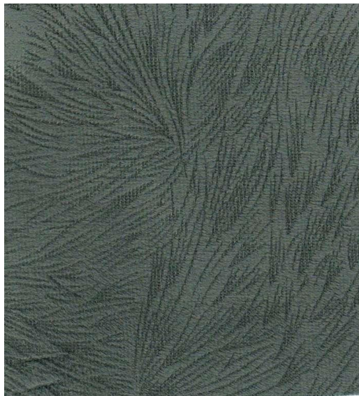
Слика 1. Узорак материјала за пресвлачење „Odiva 6“ – „Sorbona“, или одговарајући