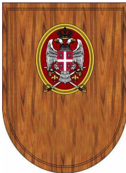
Слика 1. Идејно решење Плакете (Тип 3)

Бисери на круни се не лакирају белим емајлом, док се лакирање сафира и рубина врши само у дну круне.