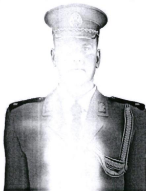
Слика 2 – Изглед акселбендера жутог

Изглед акселбендера жутог (на кориснику) приказан је на слици 2.